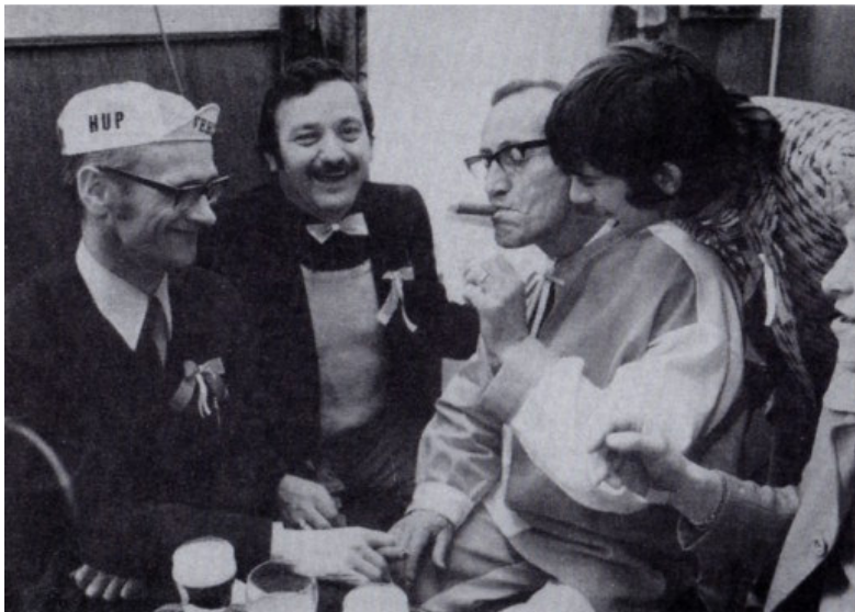
Een gezellig onderonsje na de wedstrijd.