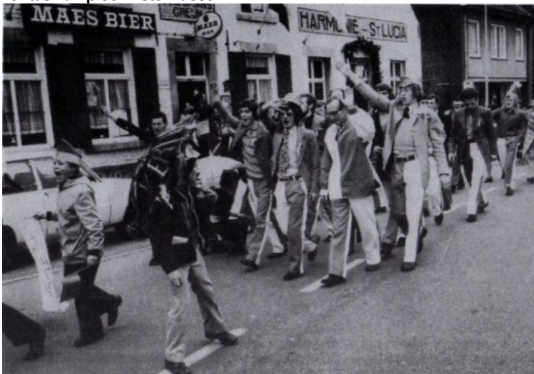
Veritas kampioen 1ste klasse F