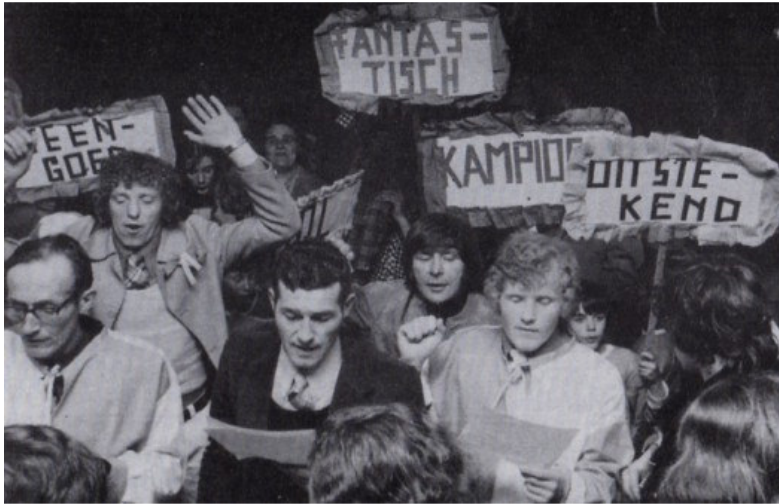
Veritas kampioen 1ste klasse F