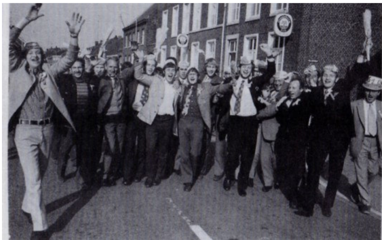
Na de overwinning op Brevendia Kampioen in de 2e klasse.