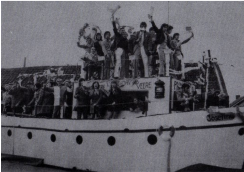
Veritas kampioen 1ste klasse F

Op maandagmorgen, na de grote dag, trekt de ploeg weer eens naar de lagere school. En de hoofdmeester stuurt, na een huldegang van de kampioenen door de schooljeugd, de leerlingen huiswaarts. Veritas is kampioen en dat mag Neeritter weten. Even later krijgen ook de kleuters vrijaf. Het juichende elftal begint aan een kroegentocht. De titel die Veritas veroverde, heeft jong en oud uit de dagelijkse sleur gehaald. Iedereen viert op zijn manier feest. De vlaggen hangen uit. Kindren lopen zingend met spandoeken door het dorp.